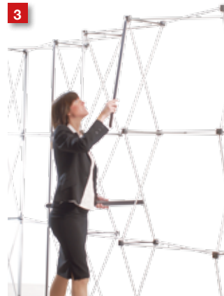
3 Mount the mag-bars...