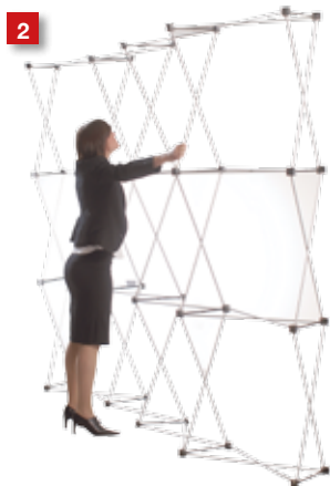
2 Snap up the framework, making sure to attach all the magnet connectors.