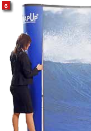
6 Wrap the end graphic around the corner.