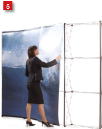
5 Mount the front panels.