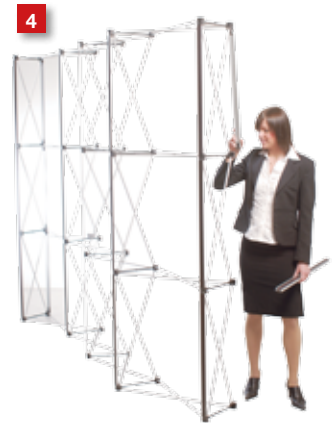
4 ...also at the last colimn at the backside.