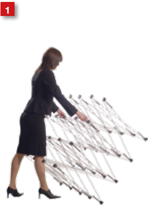
1 Grip the framework at the second row from the top.