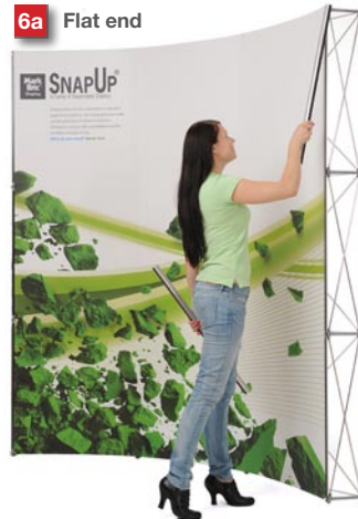
Attach 3 "Corner trims" in each corner.