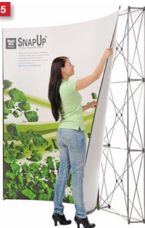
Mount the front panels.