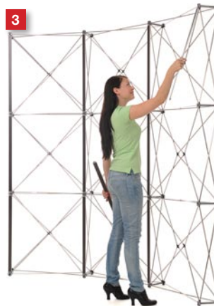
Mount the mag-bars...