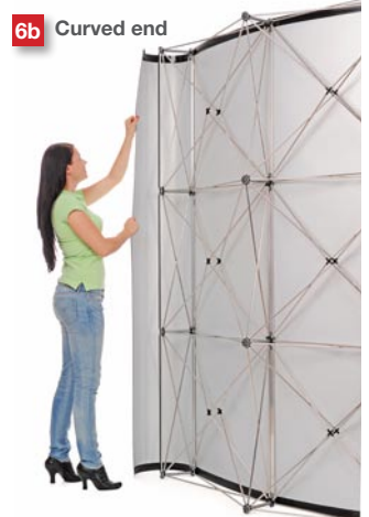
Wrap the end graphic around the corner.