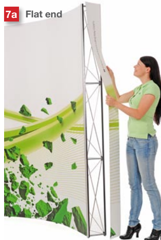
Mount the end panels.