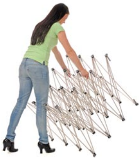
Grip the framework at the second row from the top.