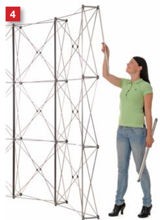
...also on the reverse side at each end.