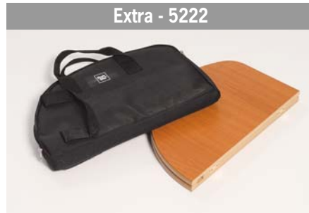
Wooden top Plateau bois